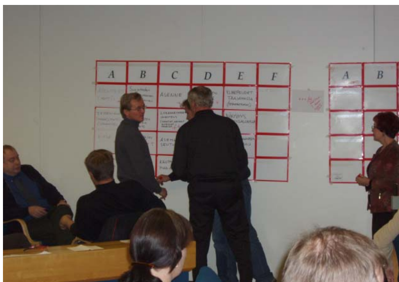
Kuva 2. Liikenneturvallisuuustoimenpiteitä ideoitiin yhdessä TuplaTiimi -ryhmätyömenetelmällä.

Näkymiseen liikenteessä liittyy ennen kaikkea turvavälineiden kuten heijastimen ja valojen käyttäminen sekä näkymistä edistävä pukeutuminen. Näkemiseen puolestaan liikkujien näkökyky, valojen käyttö sekä hämärän ajan riskien huomioiminen liikenteessä. Sekä näkemiseen että näkymiseen voidaan jossain määrin vaikuttaa myös tie- ja katuvalaistuksella. Vuoden teemaan voidaan keskittyä eri lähtökohdista oma kohderyhmä huomioiden.