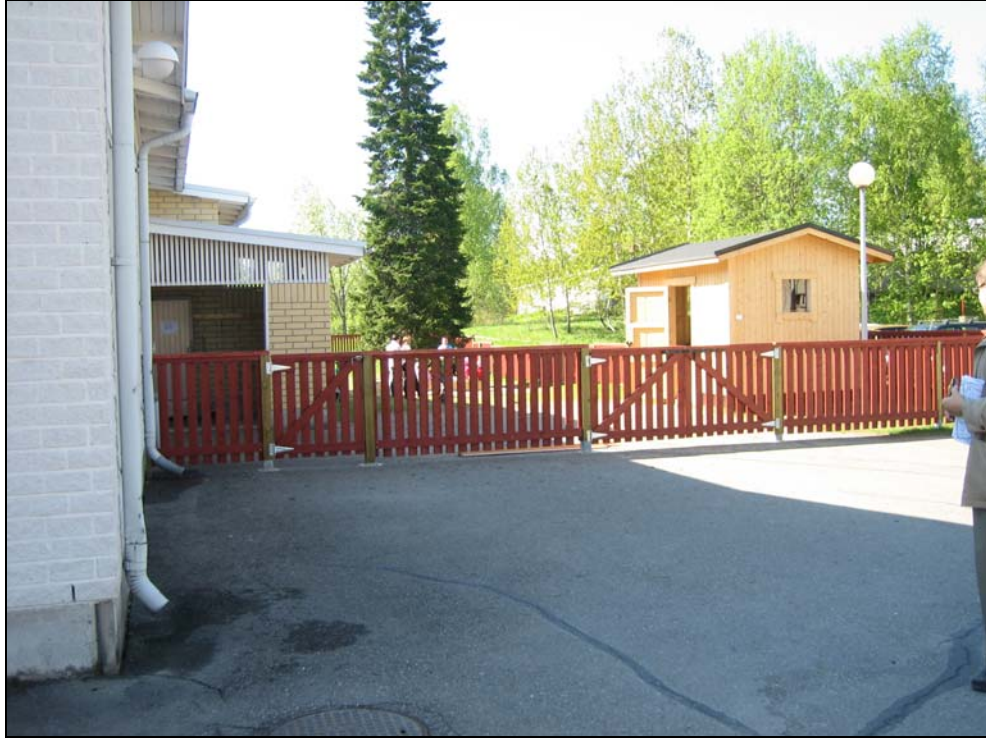
Kuva 10. Päiväkodin aidattua piha-aluetta laajennetaan länteen pysäköinti- ja nurmikkoalueen päälle.

Päiväkodin aidattua ulkoilualuetta laajennetaan länteen nykyisen pysäköintialueen päälle.