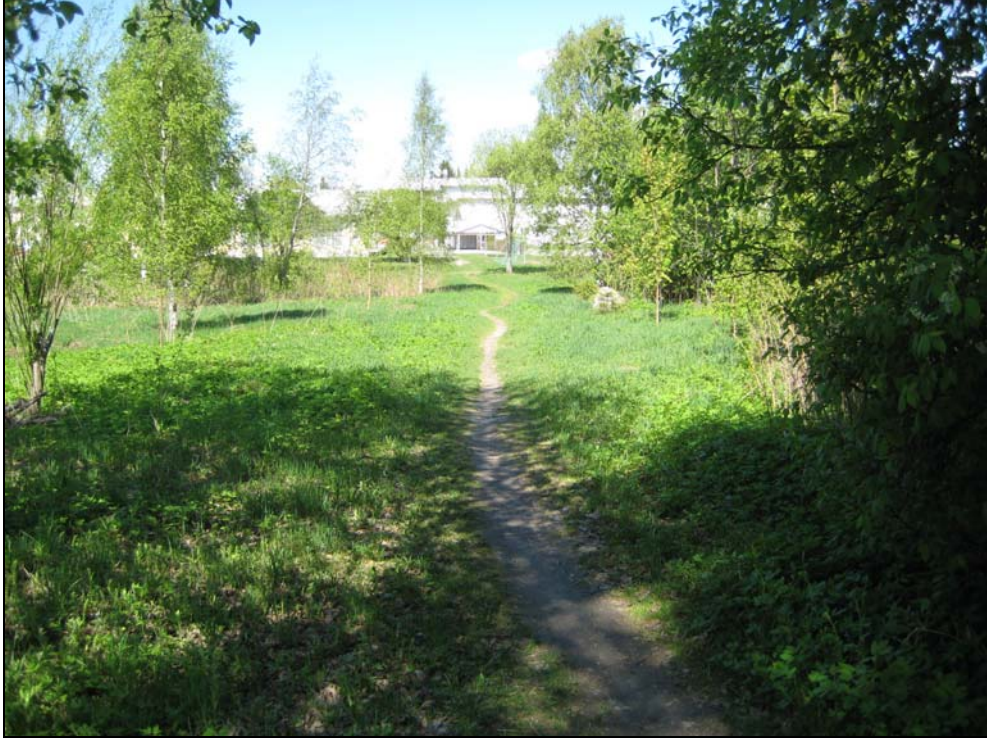
Kuva 11. Puistolankujan päästä Poukkuluoson koulupihaan johtava polku muutetaan asemakaavan mukaisesti sorapintaiseksi ja valaistuksi kevyen liikenteen väyläksi, joka au-rataan talvella.