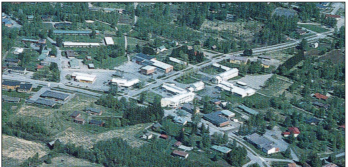
Kuva 1. Lounaasta 1990-luvun alkupuolella otettu ilmakuva suunnittelualueesta.