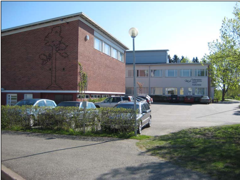
Kuva 8. Pysäköinti kirjaston sisäänkäynnin edestä poistetaan ja alueesta tehdään oleskeluaukio.

Kirjaston ja Pyhäjärventien välialueelle muodostetaan oleskeluaukio, joka kivetään, varustetaan penkeillä ja esim. suihkulähteellä tai vastaavalla. Alue muutetaan selkeästi jalkankulkualueeksi, mutta huoltoajo kirjaston ovelle mahdollistetaan.