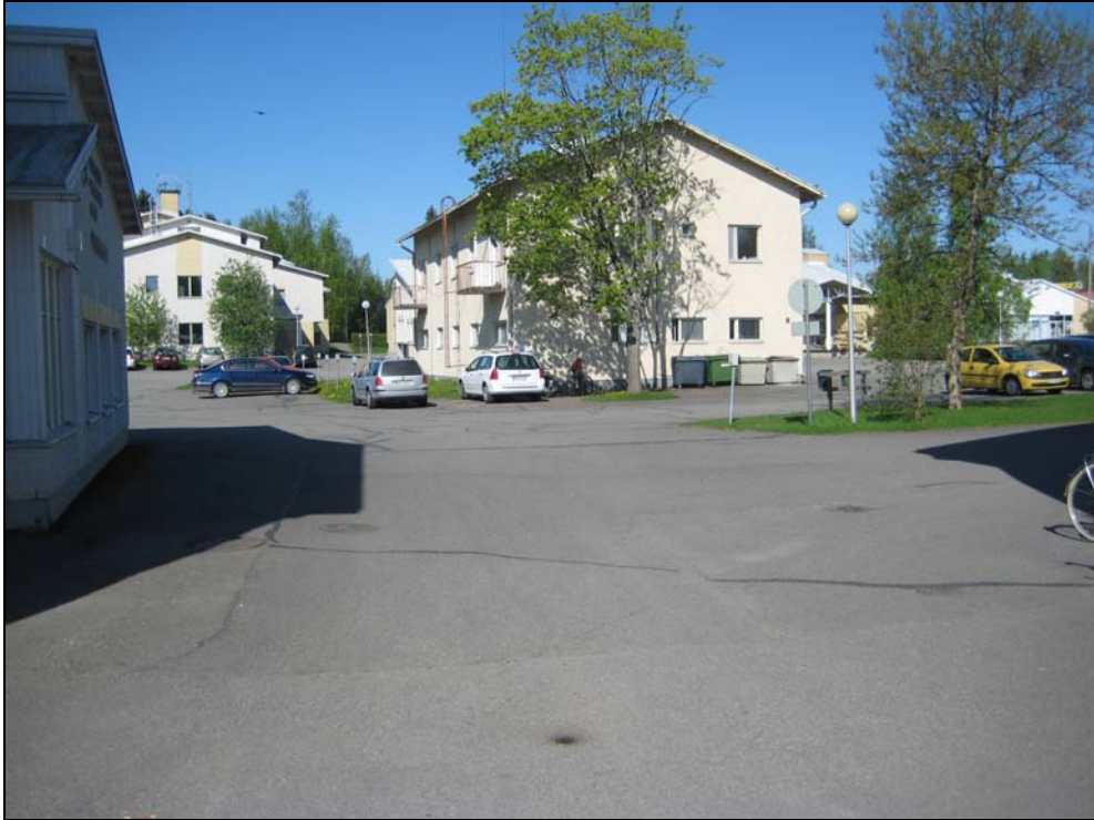
Kuva 7. Entisen paloaseman ympäristö on visuaalisesti sekava ja hankalasti liikennöitävä.