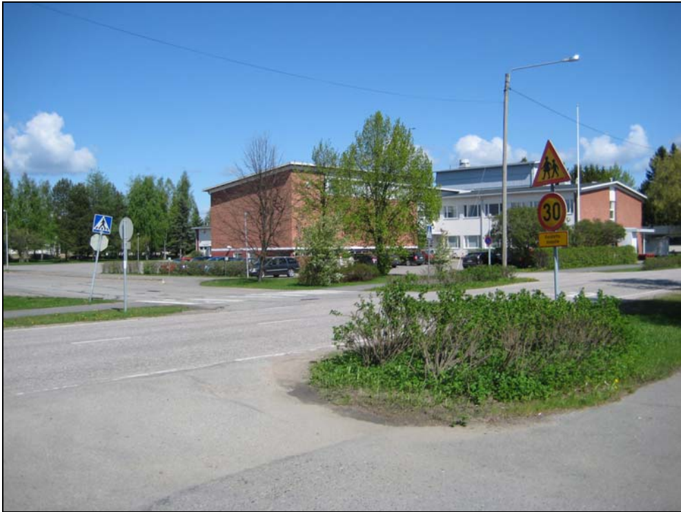
Kuva 3. Pyhäjärventien pohjoispuolisessa Puruvesi-rakennuksessa on yläkoulun luokkatiloja, ruokala-keittiö -tilat, liikuntasali ja vasemmanpuolisessa siipirakennuksessa Kesälahden kirjasto.