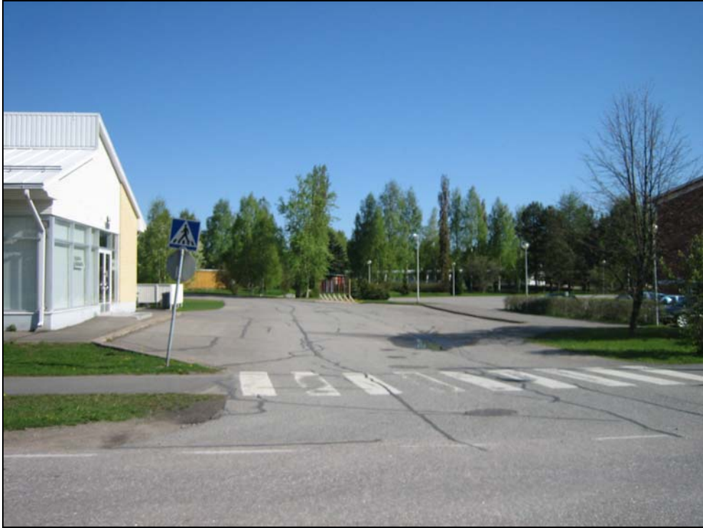
Kuva 6. Pyhäjärventien ja Tiittalantien välinen katuyhteys Pyhäjärventieltä kuvattuna. Kadun oikeassa laidassa on Puruvesi-koulua palveleva saattoliikennesyvennys. Katuyhteys on jäsentymätön asfalttikenttä, joka tarvitsisi ryhdistämistä.

Huoltoliikennettä on erityisesti Puruvesi-rakennuksen Pyhäjärventien päässä keskuskeittiön lastaussillan ruokatarve- ja valmisruokakuljetukset. Jätesäiliöitä on Pyhäjärventien eteläpuolella monessa pisteessä. Polttoöljykuljetukset Pyhäjärvi-rakennuksen koulupihan puolelle tapahtuvat päiväkodin sisäänkäynnin ohitse. Pyhäjärvi-rakennuksen pohjoispuolella on tarvetta henkilöautolla tapahtuvaan huoltoliikenteeseen mm. veistoluokan vuoksi.