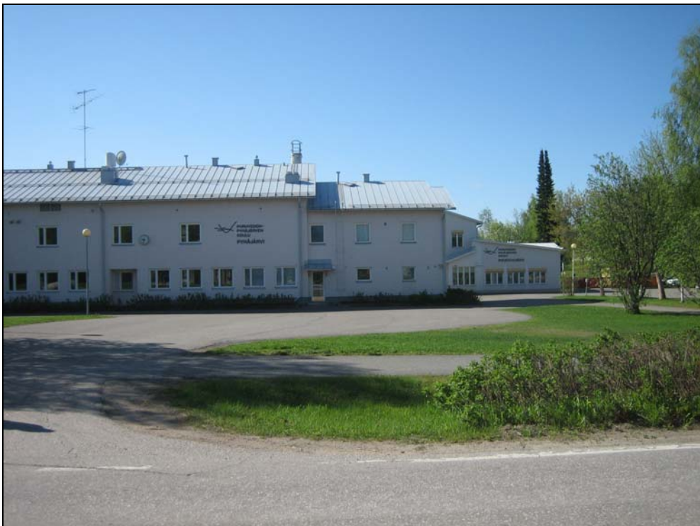
Kuva 4. Pyhäjärventien eteläpuolella sijaitsevat koulurakennukset Pyhäjärvi (etualalla) ja Poukkuluoso (oikealla takana). Poukkuluoson matalassa osassa on noin 30-paikkainen päiväkotikoulu. Koulun saattoliikenne käyttää koulun edessä olevaa aluetta.