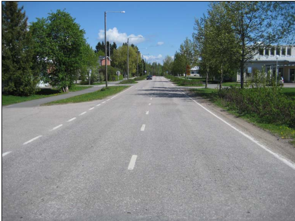
Kuva 5. Pyhäjärventie virastotalon kohdalta itään. Edessä näkyvän koulukeskuksen alueella kadulla on 30 km/h -nopeusrajoitus ja korotettu suojatie.

Tiehallinnon tierekisterin mukaan Pyhäjärventien liikennemäärä (KVL-2008) on 1200 autoa/vrk eli ei kovin vilkasliikenteinen taajaman pääkaduksi.