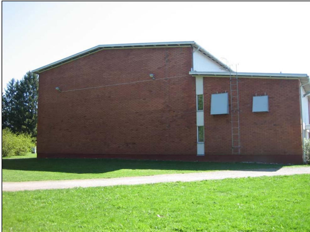
Kuva 9. Puruvesi-rakennuksen liikuntasalin seinustaa kevennetään istutuksilla.

Istutuksia lisätään mm. liikuntasalin pohjoisseinälle.